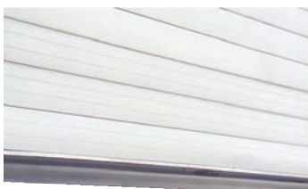
En detaljbild av nederkantens gummlist.

Motordrift med tubmotor 230 V, eller industri-motor 400 V.